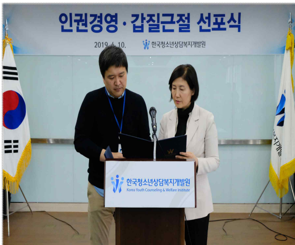
< 인권경영 선포식 >