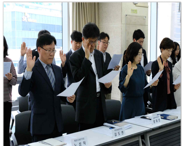
< 인권경영 선언 >