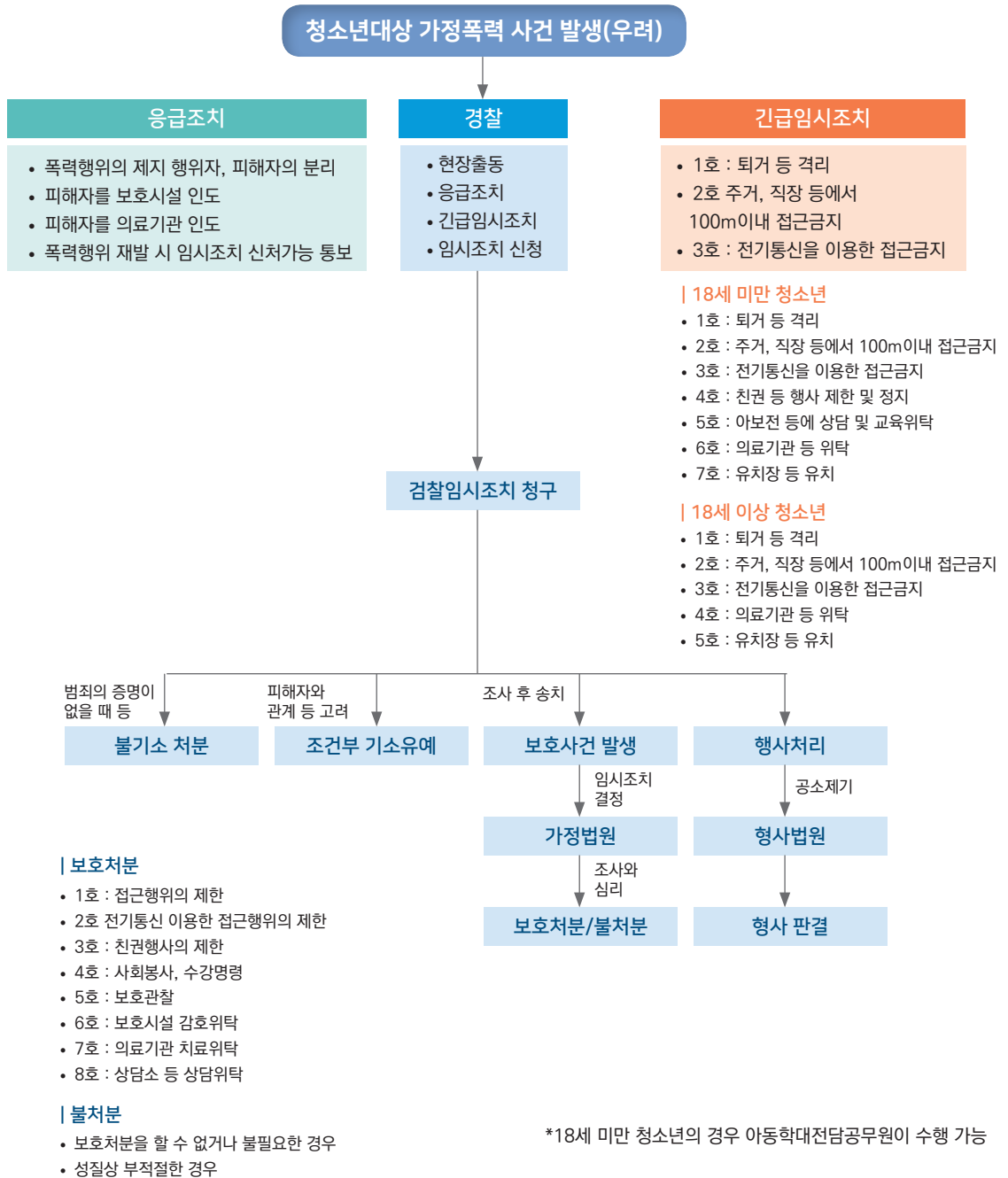
<그림 2> 청소년 대상 가정폭력 사건 발생(우려) 시 법적 절차