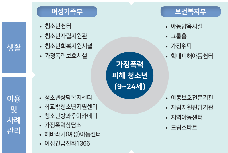
〈그림 1〉 가정폭력 피해 청소년 보호·지원체계

보건복지부는 아동관련 사업을 담당하는데 만 18세 미만이 주요한 기준이다. 가정폭력피해 아동의 경우 발생부터 보호, 사례종결 후 사후관리까지 보건복지부 산하 기관들이 담당하며 생활시설과 이용시설, 사례관리를 담당하는 기관에서 서비스를 제공한다.